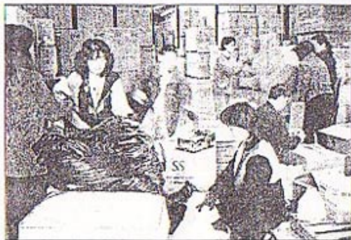
↑ 義工將捐得的衣物等分門別類裝箱。